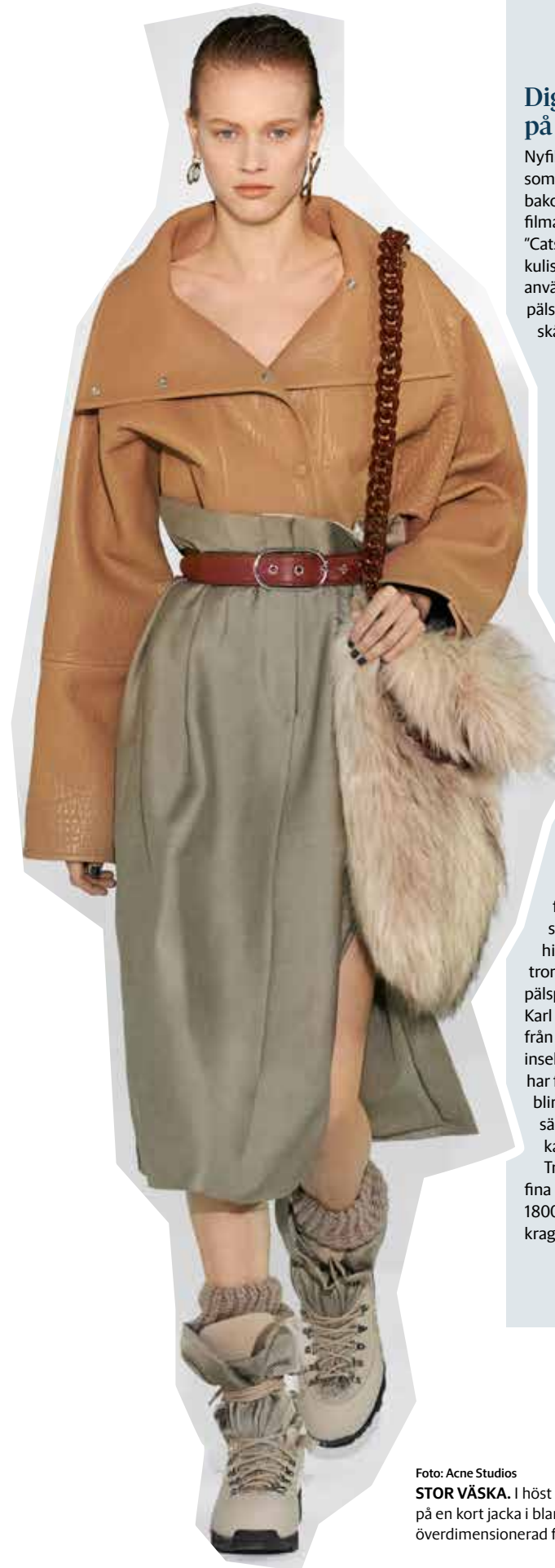
STOR VÄSKA. I höst satsar Acne Studios på en kort jacka i blankt läder och en överdimensionerad fuskpälsväska.

Så vad ska man välja: plastsinn, äkta skinn eller fruktläder? En teddypäls i chockrosa eller mormors rävpäls? Det finns inget självklart svar. Men en sak är säker – om vi sköter om våra läderprodukter, så håller de längre och får automatiskt en lägre miljöpåverkan. ♦